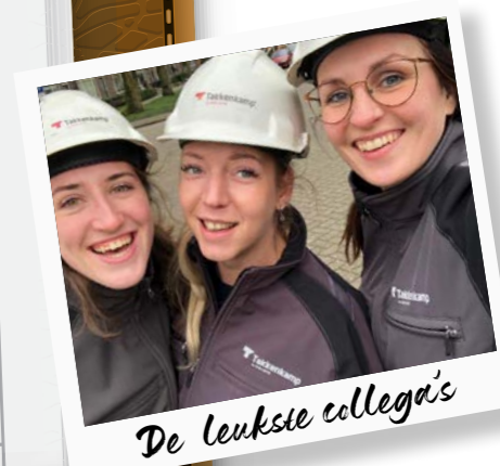
De leukste collega's