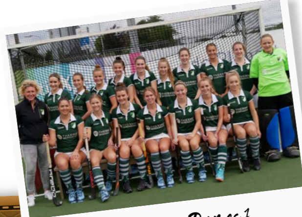
Hockeyteam - Dames 1