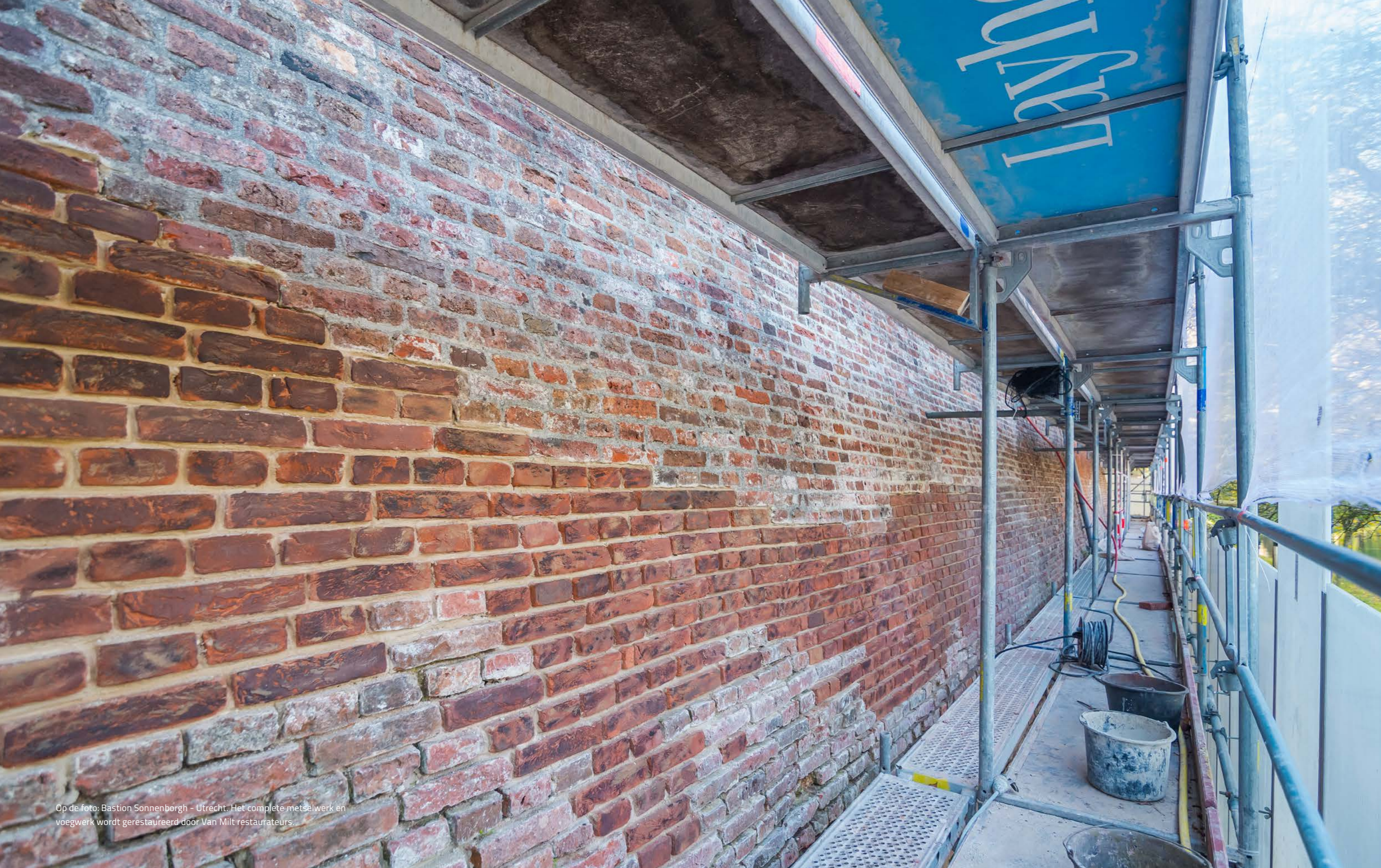
Op de foto: Bastion Sonnenborgh - Utrecht. Het complete metselwerk en voegwerk wordt gerestaureerd door Van Milt restaurateurs.